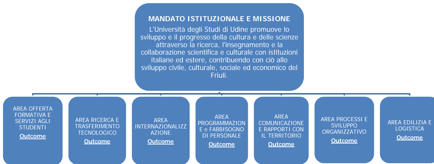
Figura 1 – Albero della performance di ateneo –

L'albero della performance 19 presenta l'articolazione del mandato istituzionale e della missione dell'Università degli Studi di Udine in aree strategiche e secondo il criterio dell' outcome . Tenendo conto che l' outcome rappresenta l'effetto delle politiche pianificate e realizzate dall'istituzione nel corso di un determinato periodo di tempo, si ritiene opportuno ricondurre tale aspetto alle aree strategiche maggiormente comprensibili per coloro che dovranno misurare tali effetti. E' opportuno quindi precisare che non vi è corrispondenza diretta tra albero della performance e articolazione organizzativa dell'ateneo e che all'interno di ogni area strategica si inseriscono programmi e obiettivi riconducibili a più unità organizzative. L'albero della performance dell'Università degli Studi di Udine si articola quindi nelle 7 aree riportate in Figura 1, individuate al fine di consentire a ciascun "portatore di interesse" di comprendere in modo intuitivo, diretto e logico come l'ateneo intenda pianificare i propri obiettivi a medio e breve termine per realizzare la propria missione istituzionale.