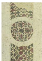
8. Facciata occid.part. San Giovanni B..