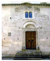
7. Portale cosmatesco San Giovanni Battista