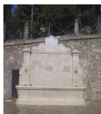
6. Fontana monumentale Piazza San Francesco