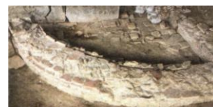
15. Struttura muraria B Terme di Carsulae

Si stanno altresì concludendo i lavori della facciata di San Francesco, compreso il dipinto murale posto nella nicchia