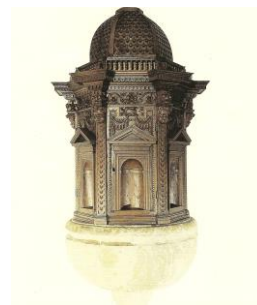
5. Portale lapideo San Francesco