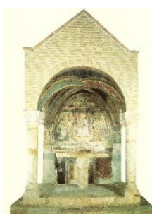
3. Madonna in trono con Bambino (San Carlo)