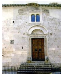
7. Portale cosmatesco San Giovanni Battista