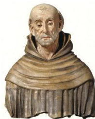
9. Busto San Bernardino Chiesa San Francesco