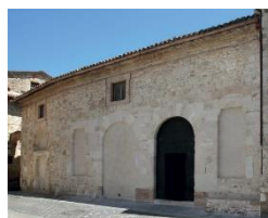
14. Facciata S.M. de Incertis (San Carlo)