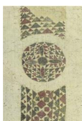
8. Facciata occid.part. San Giovanni B..