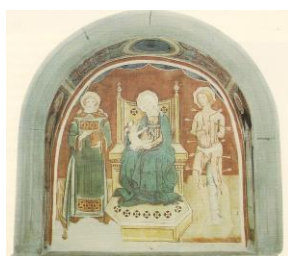
4. Madonna con Bambino tra santi (San Carlo)