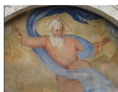
11. Lunetta con affresco Chiesa del Duomo