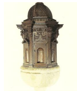
5. Portale lapideo San Francesco