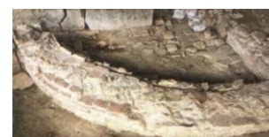
15. Struttura muraria B Terme di Carsulae

Si sono altresì conclusi i lavori della facciata di San Francesco, compreso il dipinto murale posto nella nicchia