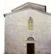
10. Facciata Chiesa del Duomo