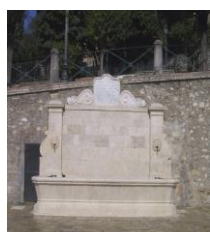
6. Fontana monumentale Piazza San Francesco