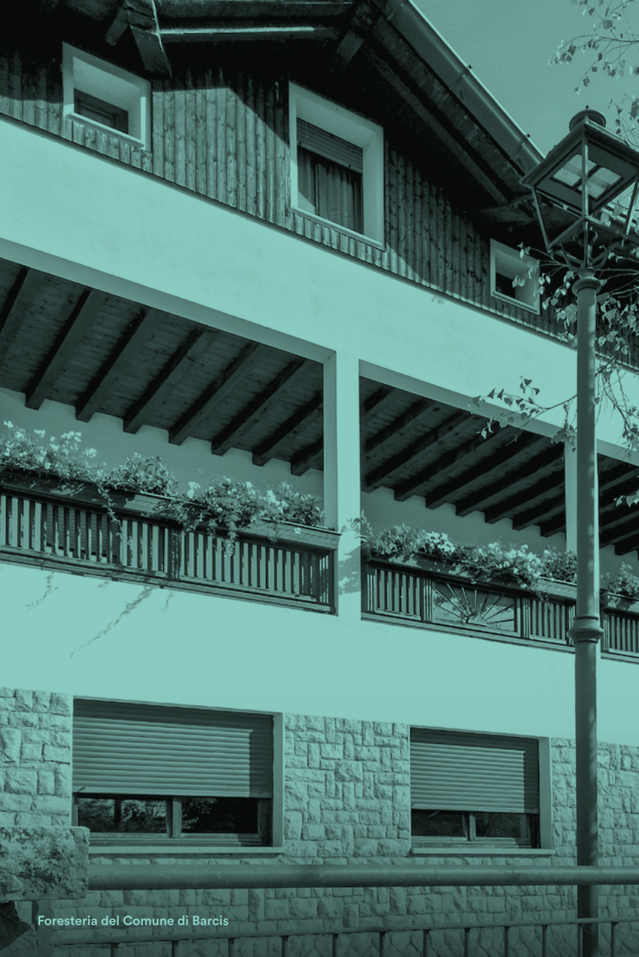
Foresteria del Comune di Barcis