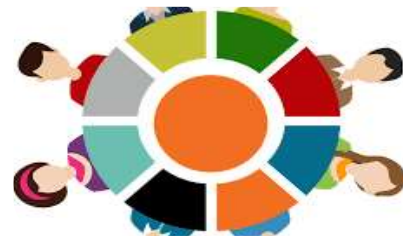
ORGANIZZAZIONE E RISORSE UMANE