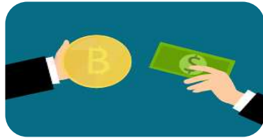
BILANCIO, FINANZA E CONTROLLO