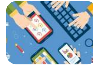
PRODUZIONE, LOGISTICA E QUALITÀ