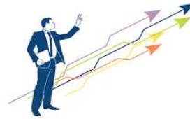
STRATEGIA E INTERNAZIONALIZZAZIONE